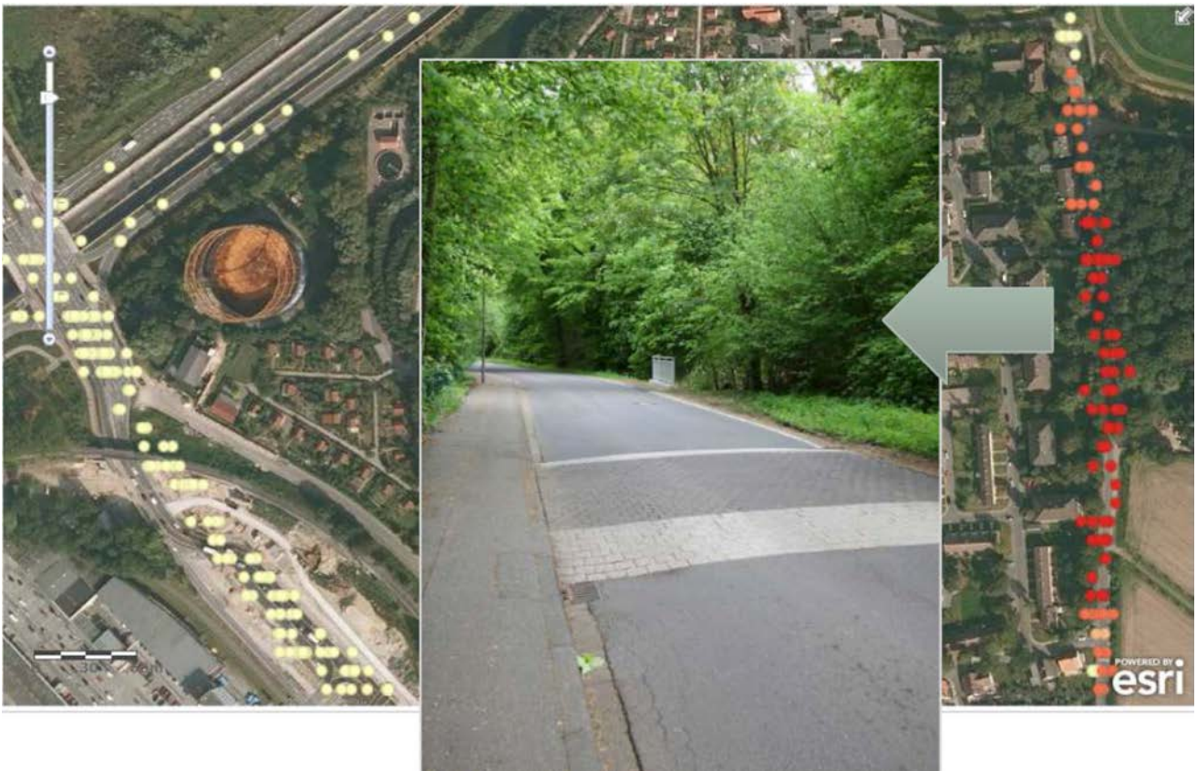
Abbildung 2: Verkehrsberuhigung als Ursache für CO2-Hotspots, nachgewiesen durch Bürgerbeteiligung und Crowd Sourcing

Ein Beispiel macht deutlich, wie Citizen Science im Mobilitätsumfeld eingesetzt werden kann. An der Universität Münster haben sich Vertreter aus Verwaltung, Wissenschaft, Industrie und Gesellschaft die Frage gestellt, wie sich ihr Fahrverhalten auf die Umwelt auswirkt und welcher CO 2 -Footprint daraus resultiert. Ferner war von Interesse, ob signifikante individuelle Abweichungen des Fahrverhaltens festgestellt werden können.