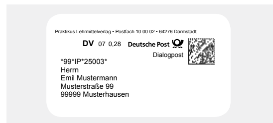
Muster für DV-Freimachung mit Datamatrixcode im Fenster

Bei der Verwendung einer zugelassenen Frankiermaschine (Freistempelabdruck Frankiermaschine oder FRANKIT) oder der Teilnahme am DV-Freimachungsverfahren (nach Vereinbarung mit der Deutschen Post) wird die Sendungsart DIALOGPOST in der Aufschrift benannt.